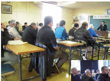
(農)のきの郷第4期通常総会

総会参加者は50名程度でしたが書面議決書、委任状の提出があり総会議決数を確保しました。今後ものきの郷の運営にご協力をお願いいたします。