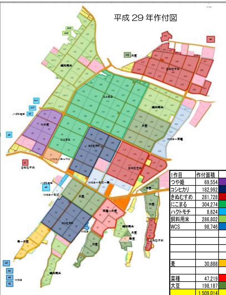
平成 29 年作付図

今年の作付計画が左図のように決定しました。春作業の準備が進んでいます。種まきなど出役依頼がかかりますので作業へのご協力をお願いいたします。